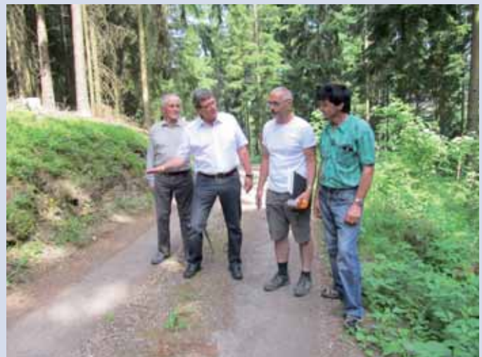
Begehung der Zufahrt Mulser.

Um 1960 wurde die Hainbergstraße errichtet und ist damit eine der ältesten Siedlungsstraßen in der Gemeinde. Mit den Anrainern der Hainbergstraße wird der Arbeitsablauf im Detail am 3. Juli besprochen. Ausführende Firma ist die Fa. Teerag- Asdag mit einem Kostenvolumen von rund € 96.300,00.