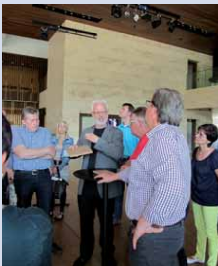
Herr Stiftinger erklärte ausführlich ihre Arbeiten im neuen Musiktheater.

Nach einem interessanten und tollen Nachmittag über die Leistungen Gutauer Gewerbetreibender und ihrer MitarbeiterInnen brachte uns der Bus wieder wohlbehalten nach Gutau zurück .