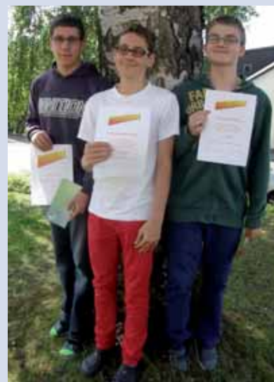
Die 3 Gewinner mit den Büchergutscheinen.

Falls ein großzügiger Privatsponsor gefunden werden kann, soll diese Aktion auch im nächsten Jahr auf Wunsch vieler Teilnehmer wieder stattfinden.