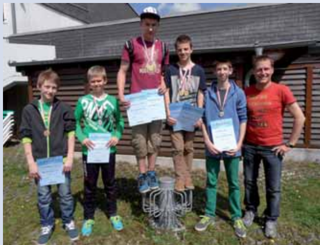
Die stolzen Schwimmer mit Medaillen und Urkunden.

Die Schwimmer der NMS Gutau waren bei den Bezirksmeisterschaften in Freistadt sehr erfolgreich!