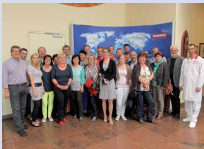
Die Teilnehmer der Besichtigung bei Backaldrin.