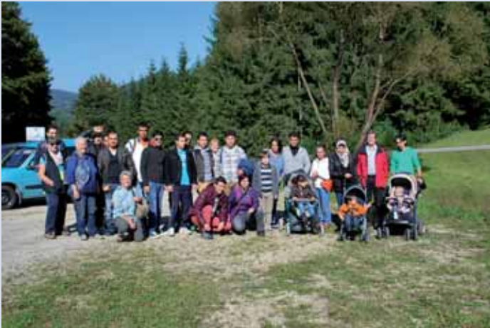
Die Asylwerber mit den Ehrenamtlichen bei der Wanderung 2013.

Für den 12. Juli hat das Team der Ehrenamtlichen für die Unterstützung des Wohnprojektes der Volkshilfe eine Wanderung zur Braunberghütte organisiert. Wir treffen uns um 13.30 Uhr am Marktplatz zur gemeinsamen Abfahrt nach Furling/Schule zum Start der längeren Wanderstrecke. Der Start der kürzeren Strecke ist in March und auch für Kinderwägen geeignet.