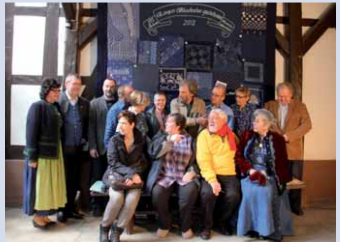
Eine Abordnung der letzten Blaudrucker Europas in der ältesten Blaufärberei Deutschlands in Einbeck.