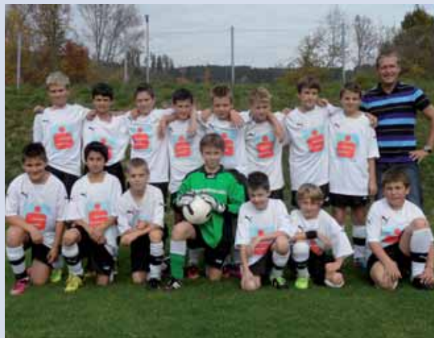
Schülerliga der NMS Gutau.

Toller Erfolg der NMS Gutau: 3. Platz im Bezirk Freistadt