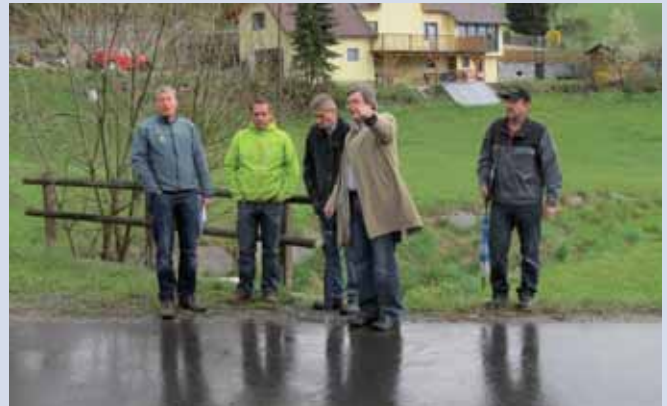
Begehung beim Gutauerbach.

Die Wildbach- und Lawinenverbauung, Gebietsbauleitung Mühlviertel, errichtet oberhalb des Hauses Bahr einen Rechen zum Rückhalt von Schwemmgut (Holz udgl.). Im Bereich des ASZ und des ehemaligen Lagerhauses wird der Gutauerbach geöffnet. Dafür gilt es die Brücke an der St. Oswalderstraße zu vergrößern und die Auffahrt zu den Häusern Aichhorn und Wachs mittels einer Brücke neu zu bauen. Durch diese Maßnahmen wird die Durchflussfähigkeit des Gutauerbaches wesentlich erhöht. In den letzten 10 Jahren musste die St. Oswalderstraße zweimal saniert werden. Dies gehört dann der Vergangenheit an. Der Schutz bei kleinräumigen Überflutungen wird für die anliegenden Liegenschaften ebenfalls verbessert, wenngleich immer gilt: einen 100%-igen Schutz gibt es nicht.