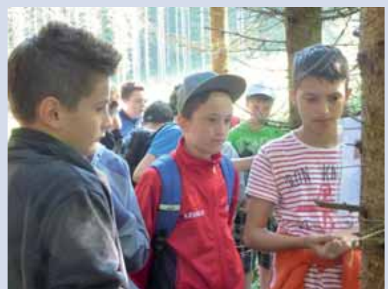
Die Aufgaben wurden erfolgreich gelöst.

Stolz präsentieren die Mädchen der 2. Klasse ihre Hauben und Schals, die sie im Werkunterricht gestrickt haben.