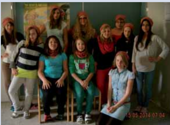
Die Mädchen präsentierten stolz ihre Werke.

Am 20.5.2014 beteiligten sich die Schülerinnen und Schüler der NMS an den Naturerlebnisspielen in St. Leonhard. Eifrig lösten sie gemeinsam die vielfältigen Aufgaben und waren dabei äußerst erfolgreich. Als Andenken gab es für jede/n einen kleinen Tannenbaum für den eigenen Garten.