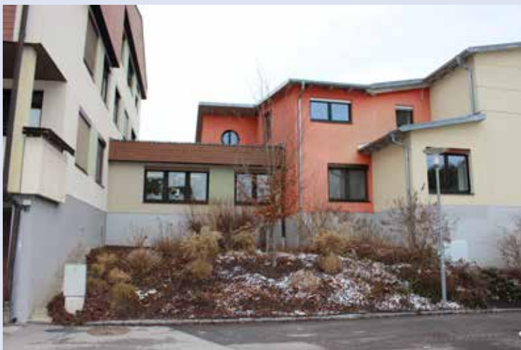
Hier wird die Krabbelstube errichtet.

Die Bauverhandlung wurde Ende Jänner erfolgreich durchgeführt. Die Kostensteigerungen hat die Landesregierung genehmigt. In der Gemeinderatsitzung am 10. März werden der neue Finanzierungsplan und die ersten Bauaufträge zur Genehmigung vorgelegt.