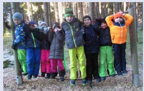
Die Kinder vom Hort Gutau haben am Spielplatz sehr viel Spaß.

Große Freude haben die Kinder vom Hort Gutau am Spielplatz inmitten des Vogelkundeweges. Bewegung und Sport ist für die geistige und körperliche Entwicklung der Kinder ein wichtiger Faktor. Aktuelle Hygiene- und Sicherheitsmaßnahmen erschweren Bewegungsangebote im Innenbereich. Der Hort Gutau verlegt daher Freispielphasen im Tagesablauf vorwiegend ins Freie. Bewegung muss nicht immer bei Schönwetter stattfinden! Unterschiedliche Jahreszeiten bringen vielfältige Erlebnismöglichkeiten für die Kinder. Spielen im Schnee, Waldtage und aufregende Gartenbesuche gestalten den Hortalltag für die Kinder spannend und erlebnisreich. Die Kinder haben somit die Chance, kreative Spielideen gemeinsam mit Freunden/Freundinnen umzusetzen. Das alles frei von Masken- und Abstandsregeln! Auch wenn bei den Kindern Verständnis und Toleranz für Masken im Indoorbereich besteht, ist jeder