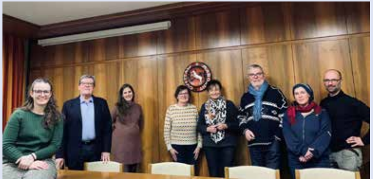
Das fleißige Organisationsteam

Am Färberwochenende werden die Investitionen eröffnet.